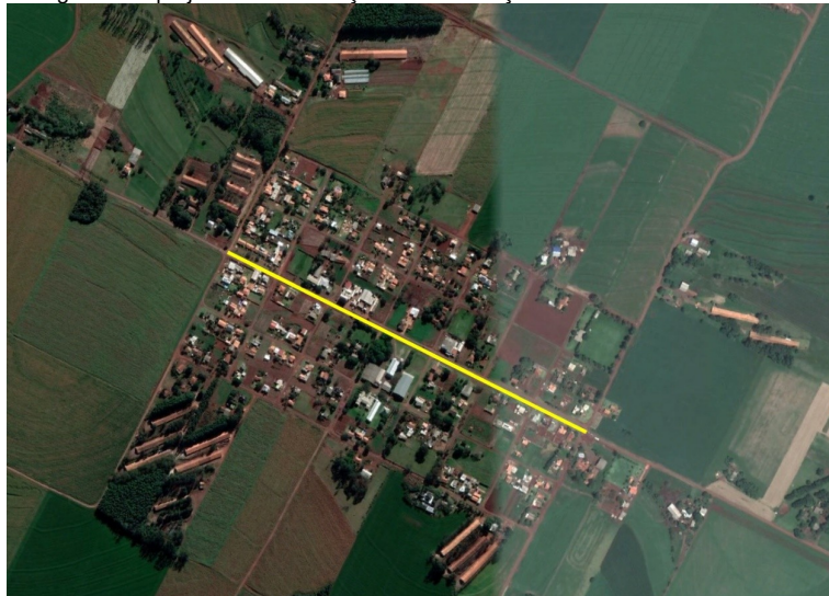
Rua 1º de Maio do Distrito de Bom Princípio de Toledo/PR Toledo – PR extensão total 840m

O presente memorial trata das orientações para execução das obras de urbanização da Rua 1º de Maio integrante do projeto de Urbanização e Revitalização das Ruas do Distrito de Bom Princípio.