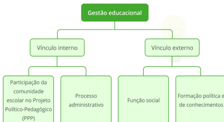
Figura 1 – Modelos institucionais interno e externo da gestão escolar.

Em suma, todos os entendimentos são voltados ao contexto da democratização que pode ser compreendida, a partir do viés da gestão escolar em duas vertentes. Quando há o contexto de democratização, surgem dois aspectos estruturantes, conforme a figura a seguir: