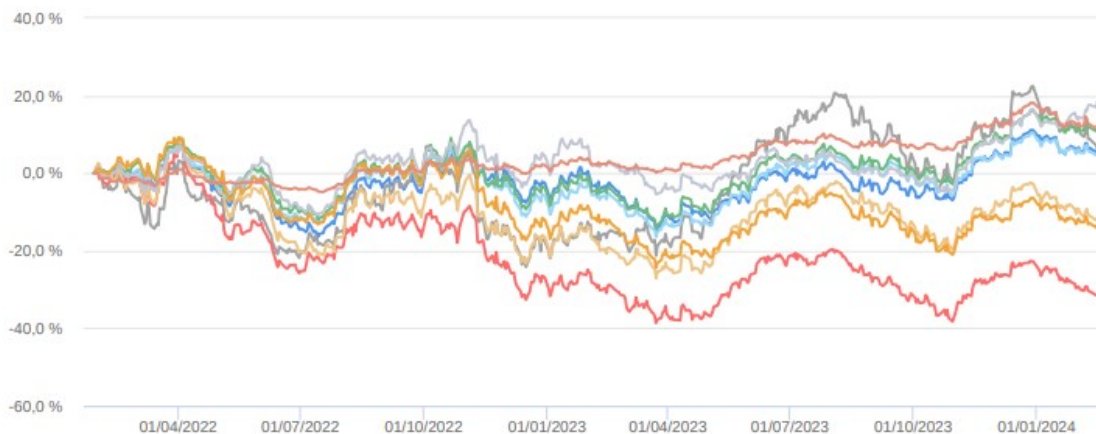
Retorno acumulado - 31/01/2022 até 16/02/2024 (diária)