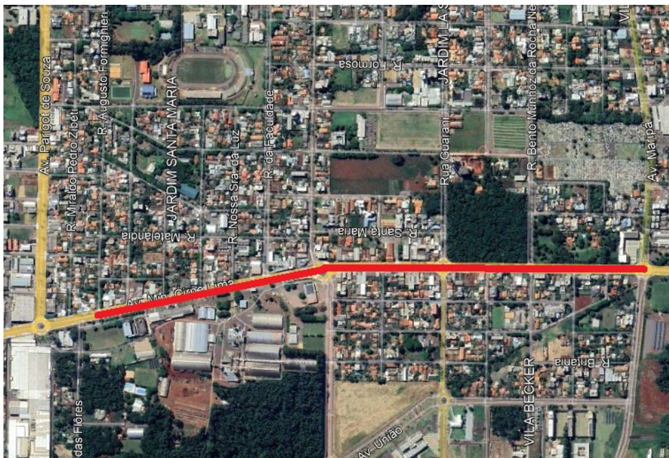
Figura 1 – Avenida Ministro Cirne Lima, compreendendo o trecho entre a Avenida Maripá e a Rua Augusto Formighieri, totalizando aproximadamente 1.525 metros.

O presente memorial trata das orientações para execução da obra referente a Ciclovia e reforma de passeio público da Avenida Ministro Cirne Lima, compreendendo o trecho entre a Avenida Maripá e a Rua Augusto Formighieri, totalizando aproximadamente 1.525 metros conforme apresentado na Figura 1.