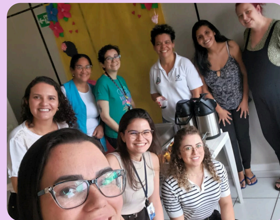
CENTRO DE SAÚDE