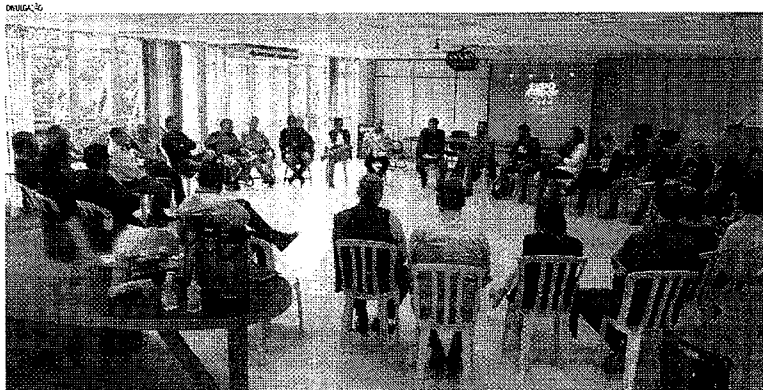
O evento está marcado para os dias 21 a 25 de julho, no parque de exposições rondonense