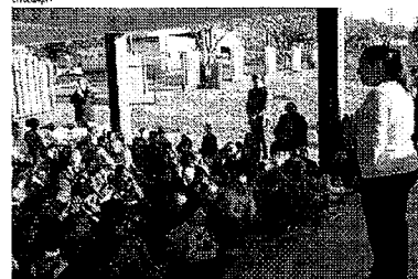
O projeto irá incentivar os alunos da rede municipal de ensino e do CAMEI Casinha Feliz a terem uma biblioteca em casa

"Ao longo do ano, os alunos do maternal até o 5º ano receberão 12 livros. Todos os meses, as escolas farão um dia de leitura, momento em que um novo livro será entregue aos