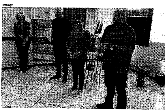
A jornada explora sobre conhecimentos específicos a respeito de como ganhar, economizar e investir