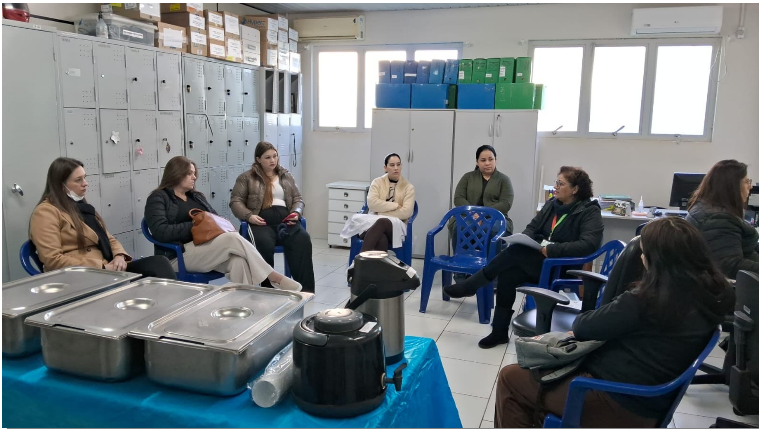
Grupo de Gestante JARDIM PORTO ALEGRE