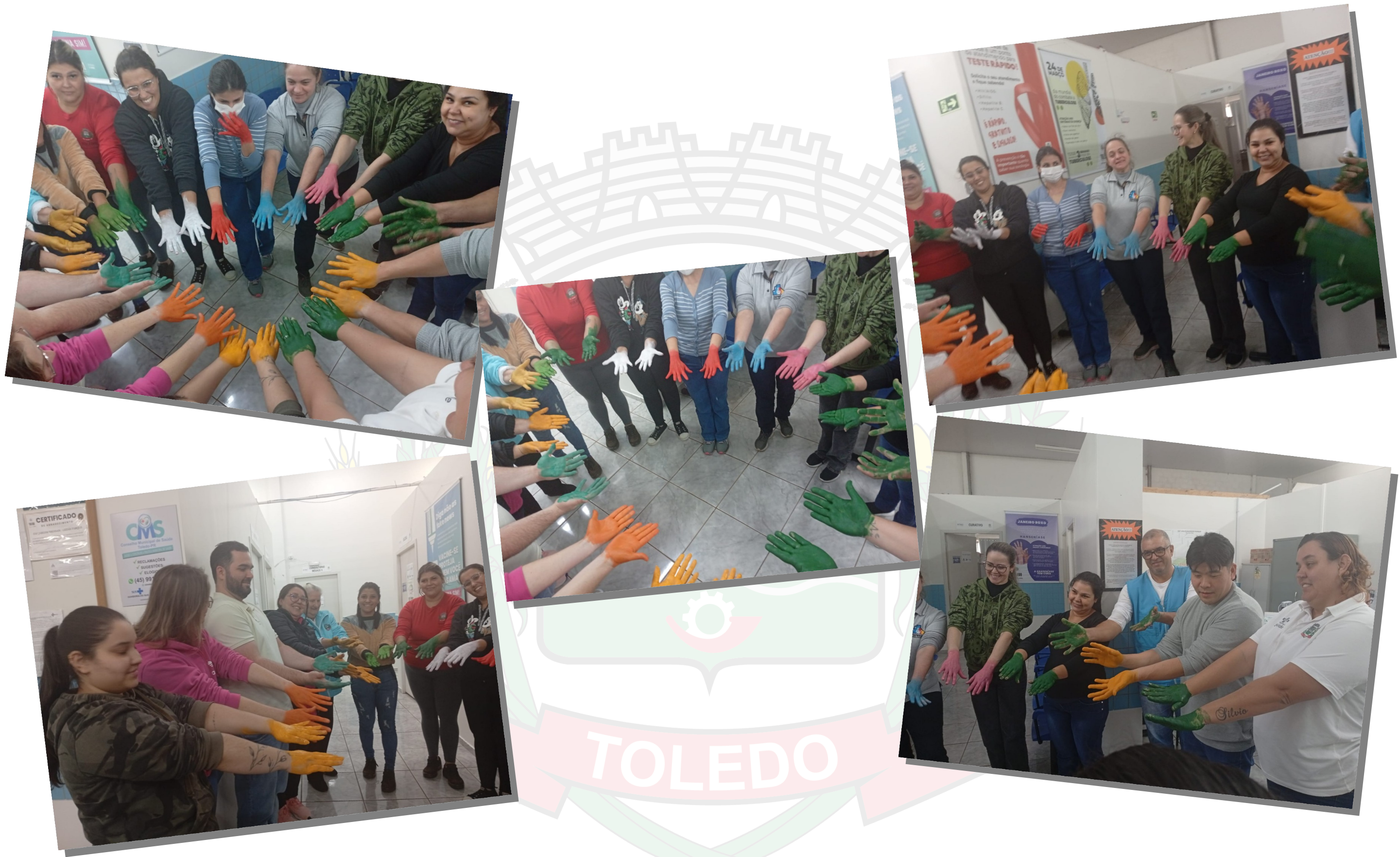
Treinamento POP, lavagem das mãos BRESSAN