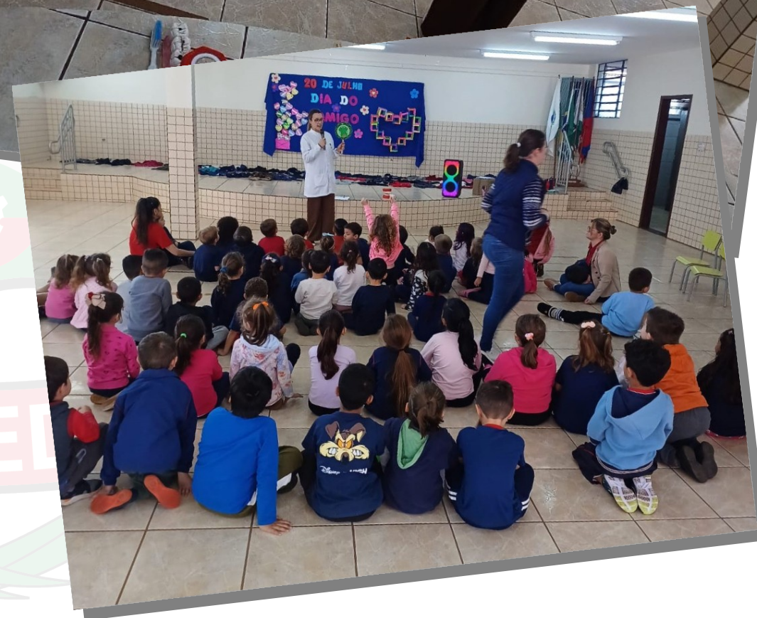
PSE na Escola Arsenio Heiss JD. PORTO ALEGRE