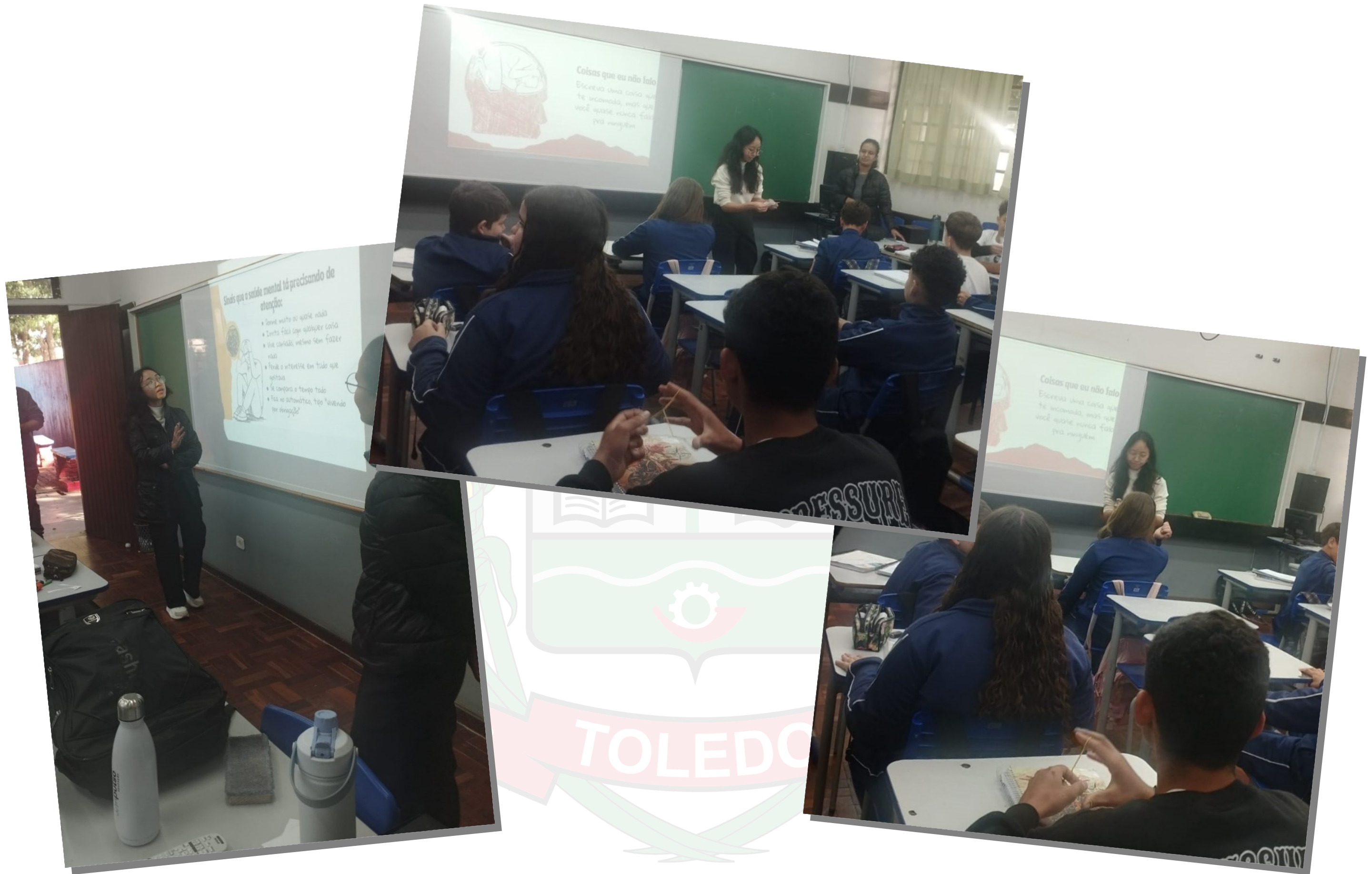
Apresentação sobre Saúde Mental e Cultura da Paz para adolescentes da Escola Estadual João Arnaldo Ritt COSMOS