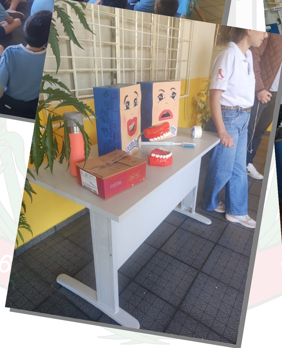
PSE na Escola Municipal Miguel Dewes com a equipe de Saúde Bucal DEZ DE MAIO