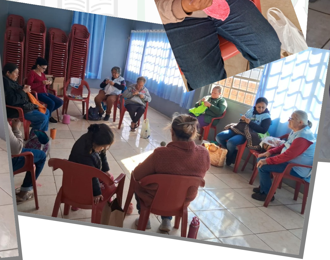
Grupo de crochê JD. PANORAMA