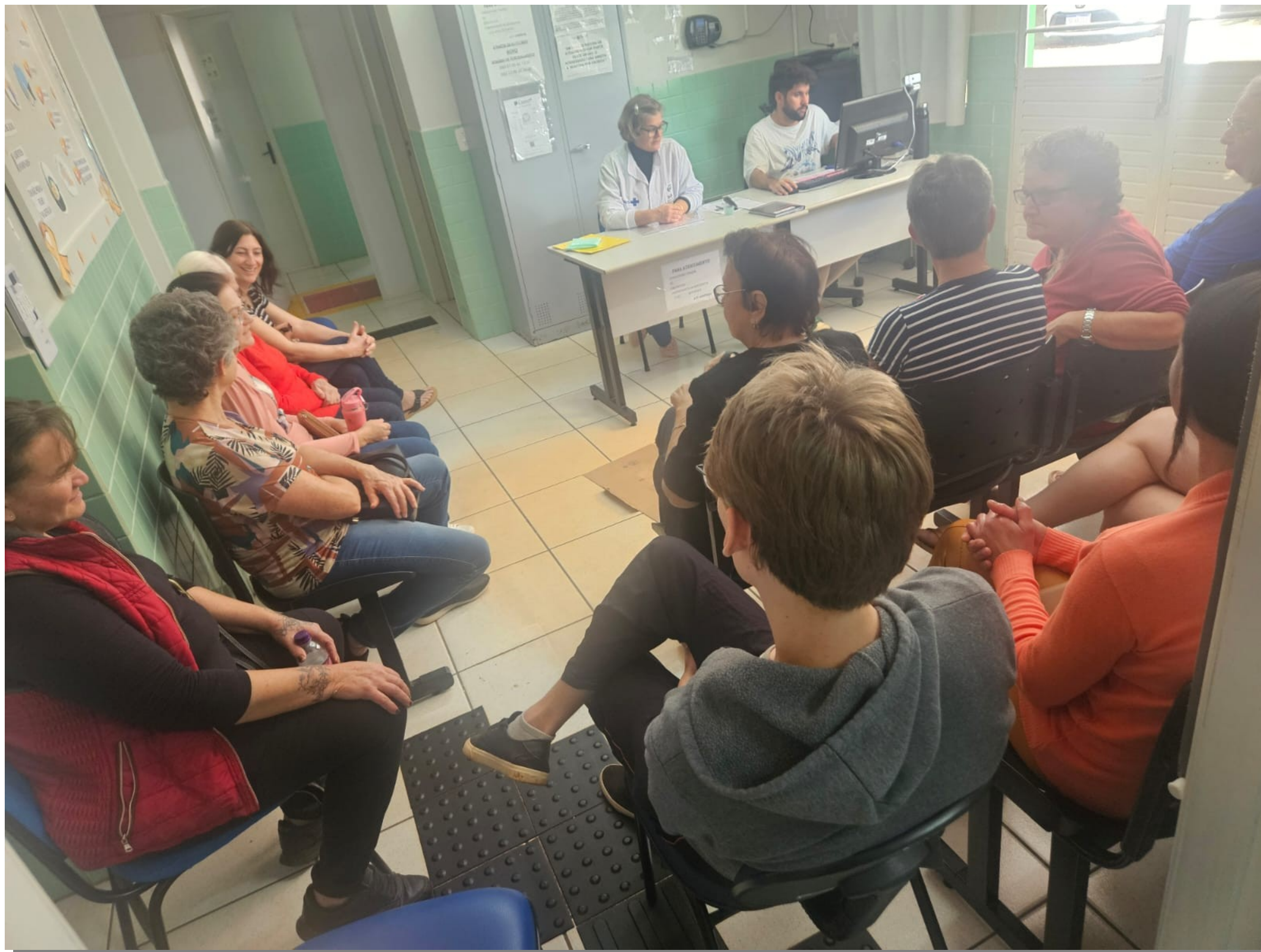
Grupo de promoção à saúde CONCÓRDIA DO OESTE