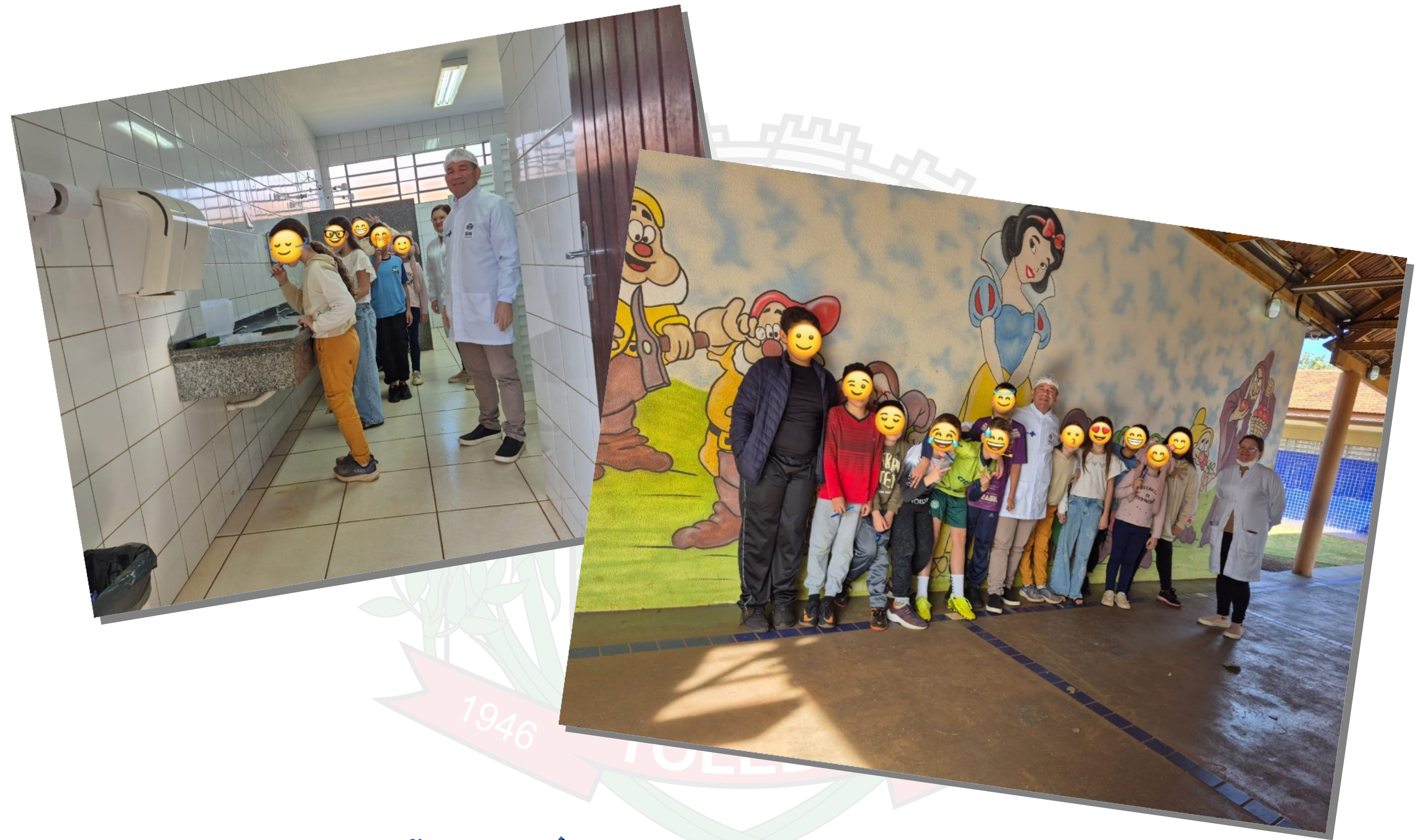
Ação em Saúde Bucal na Escola Waldir Becker COSMOS