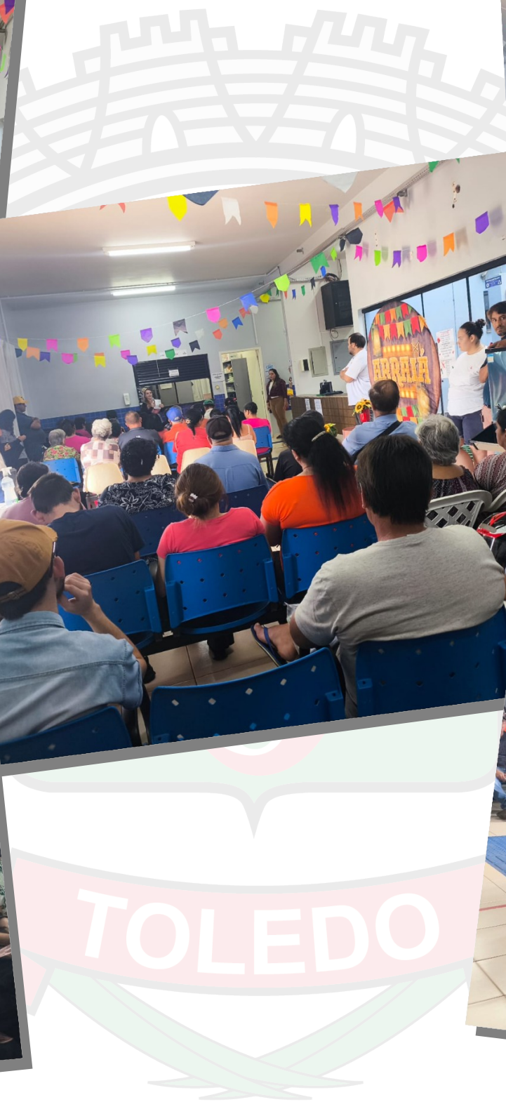
Arraiá do Santa (grupo renovação de receita) palestra sobre cuidados odontológicos SANTA CLARA IV