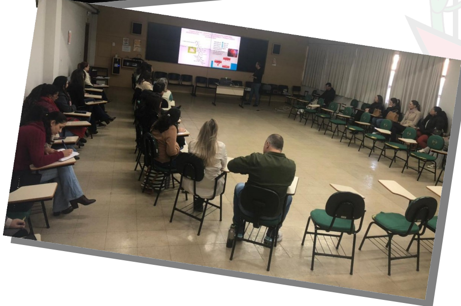
Capacitação em suporte básico de vida para as equipes de Saúde Bucal COOPAGRO