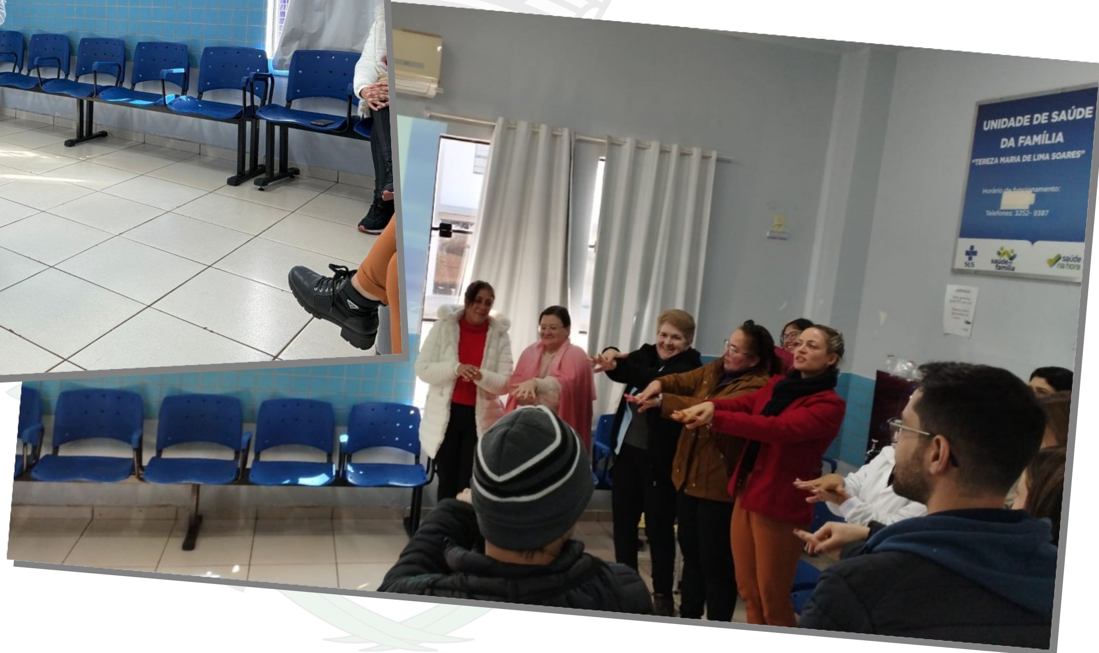
Educação continuada com a equipe da Unidade de Saúde Cosmos referente ao protocolo de higienização das mãos