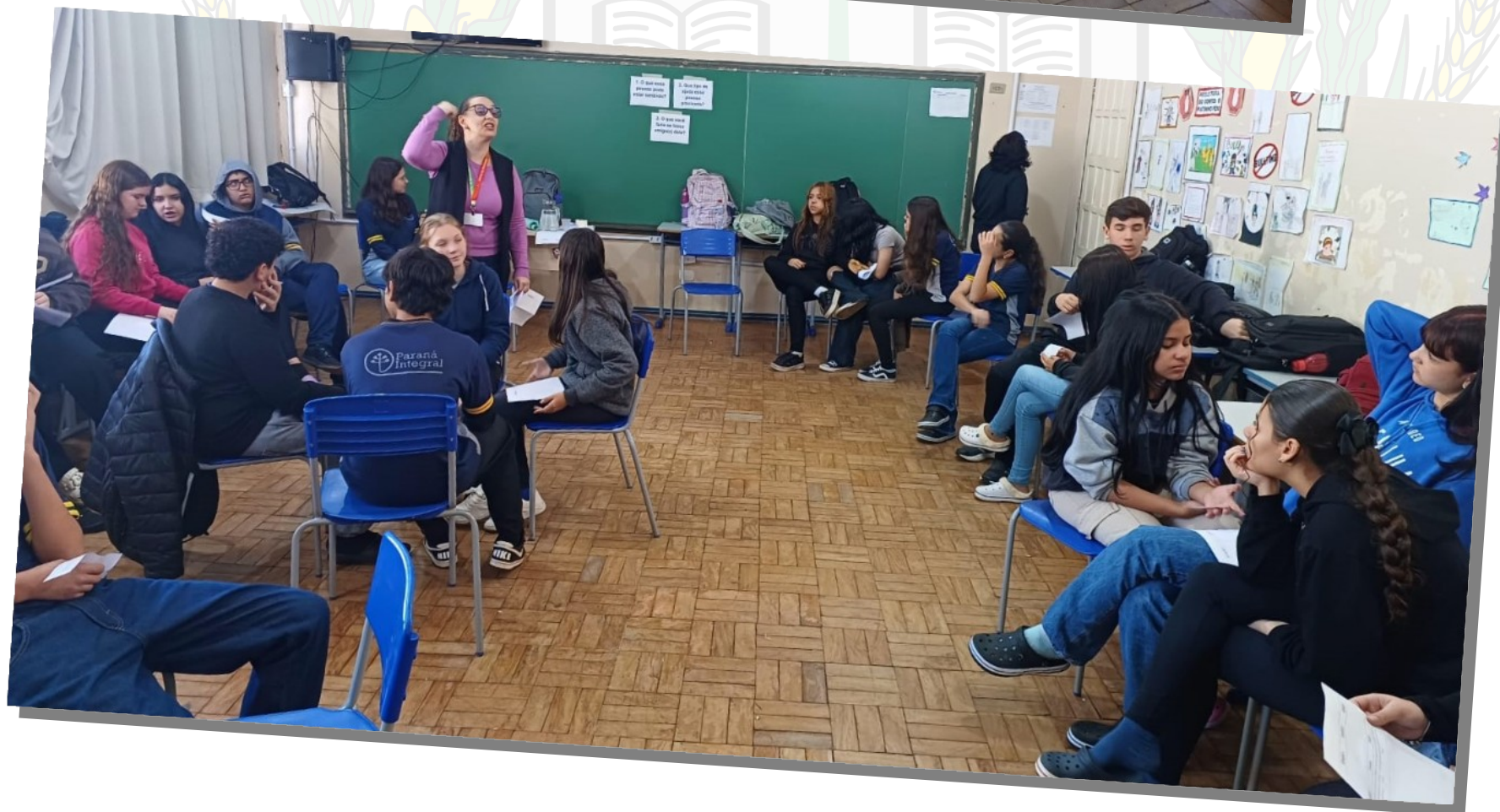
PSE na Escola Jardim Porto Alegre JARDIM PORTO ALEGRE