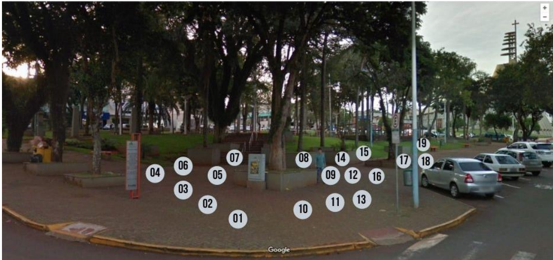
Esquina da Rua 7 de setembro com a Rua Dom Manuel D'Elboux