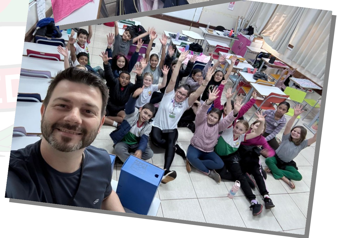
PSE na Escola Municipal Duque de Caxias em Concórdia do Oeste