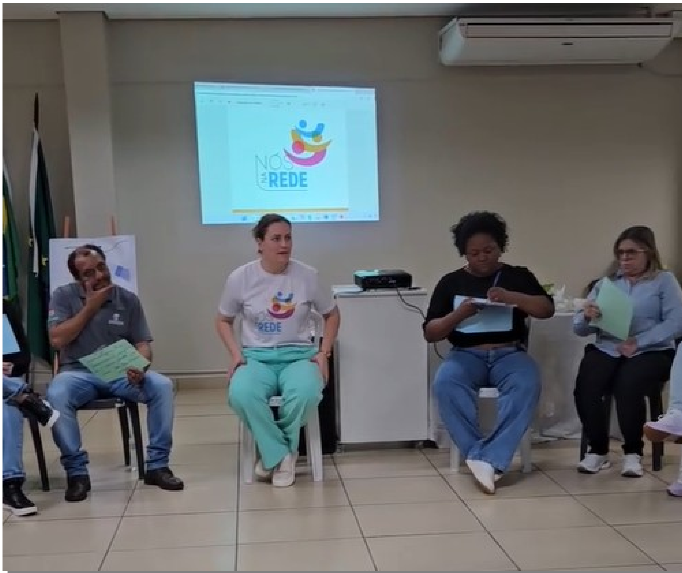
Capacitação em Saúde Mental realizada pela Unidade de Saúde do Jd. Concórdia