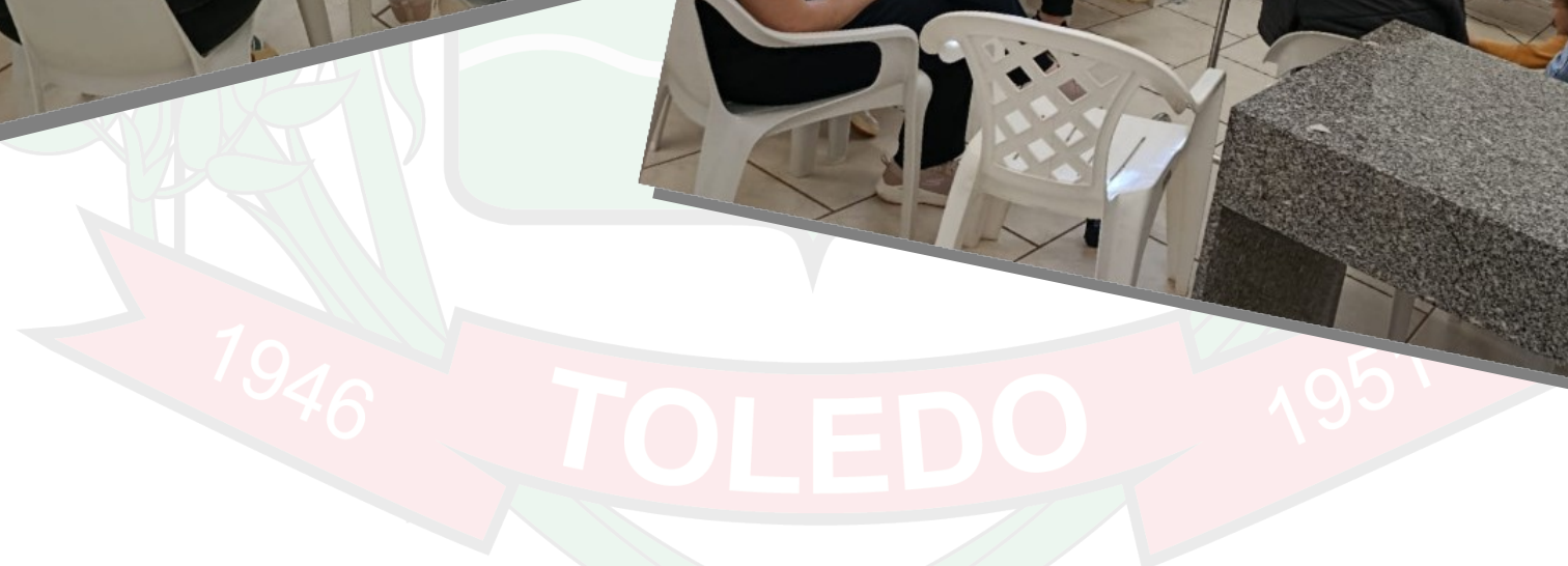
Grupo de Gestantes da Unidade de Saúde do Alto Panorama abordando o tema “Agosto Dourado”