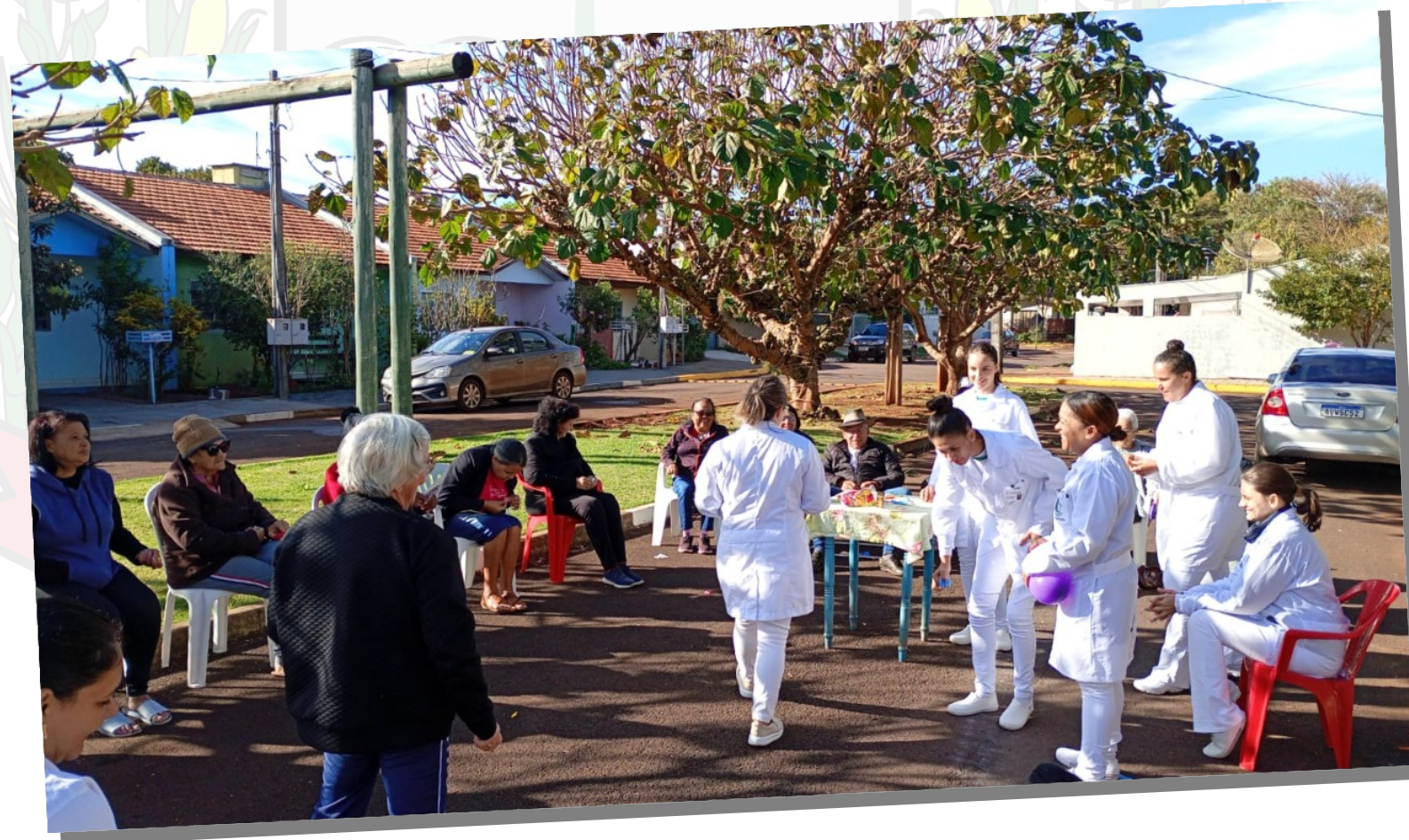
Roda de conversa em Saúde Mental promovido pela Unidade de Saúde Coopagro e Colégio Dario Velozo