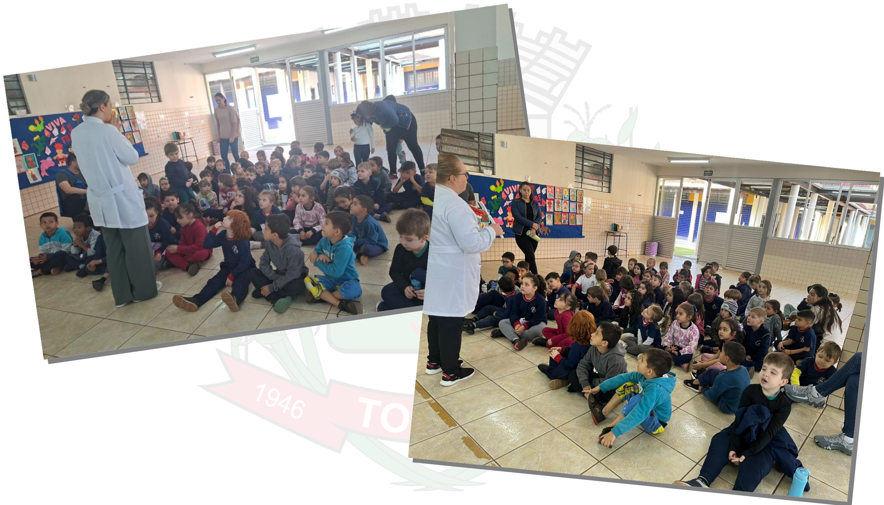
PSE na Escola Arsenio Heiss JD. PORTO ALEGRE