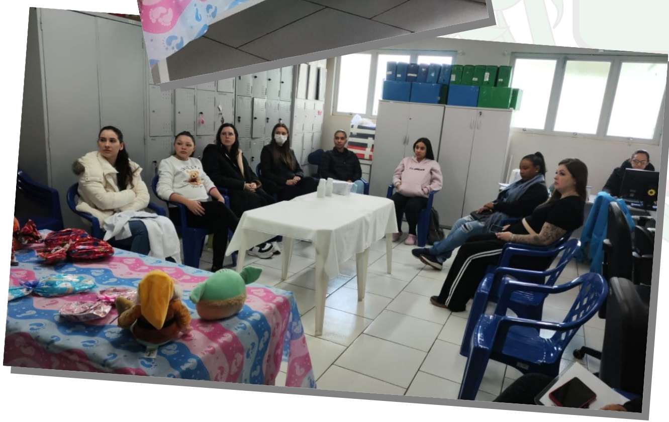
Grupo de Gestantes JD. PORTO ALEGRE