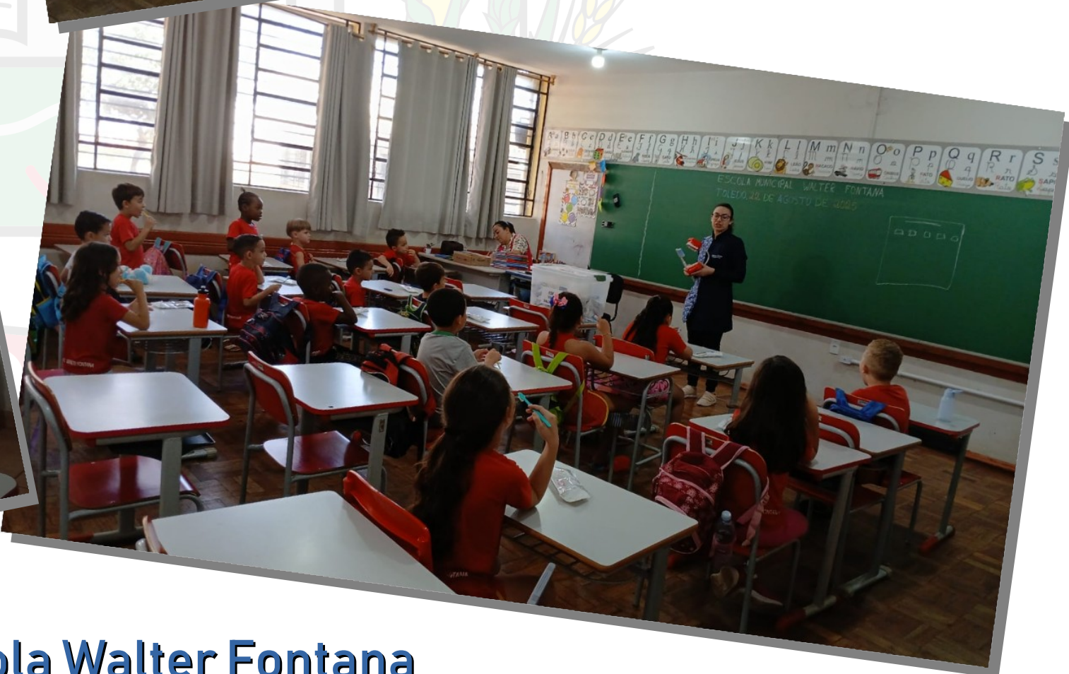
PSE na Escola Walter Fontana JARDIM PAULISTA