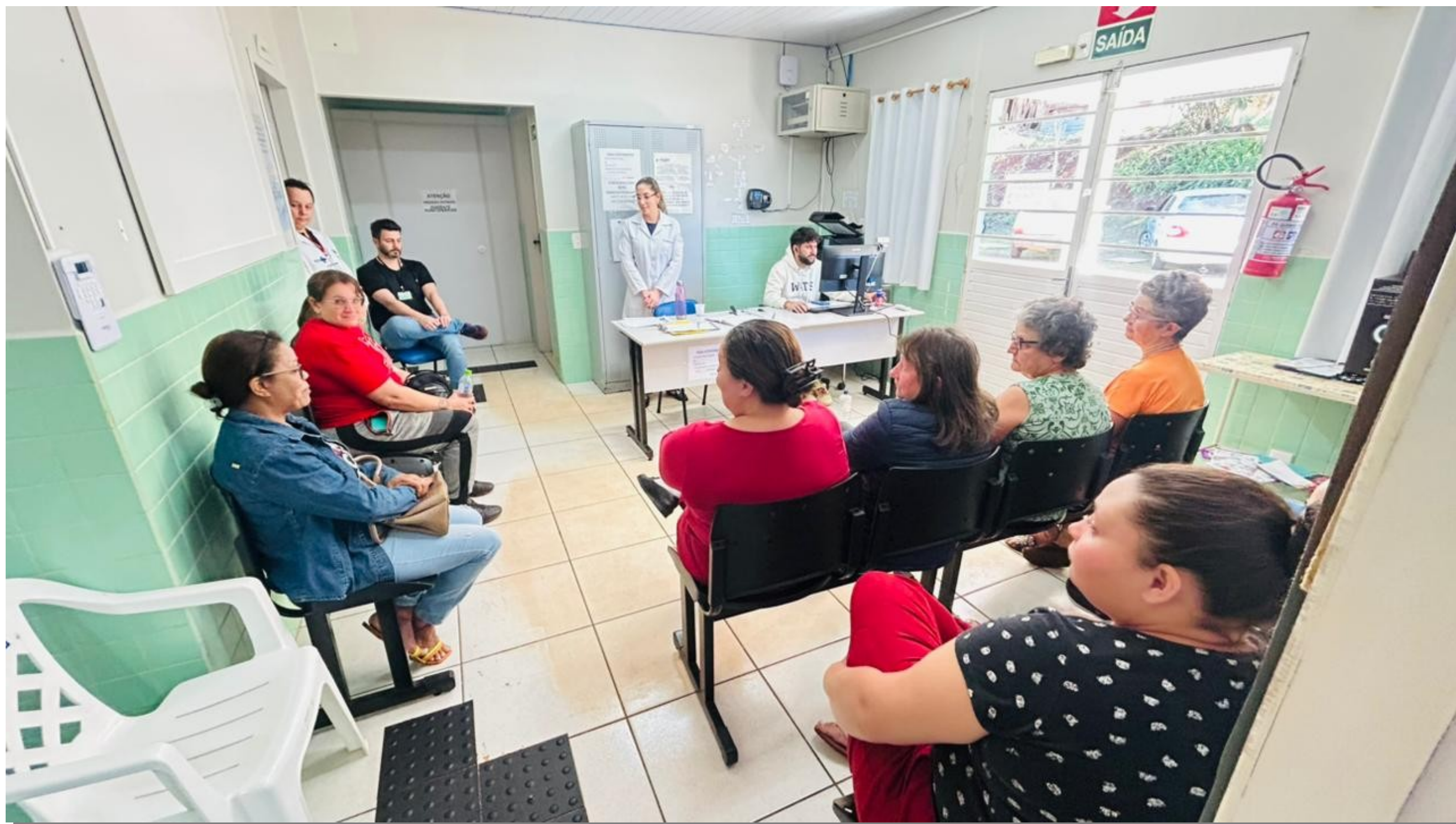
Grupo de Promoção à Saúde, da Unidade de Saúde de Concórdia do Oeste