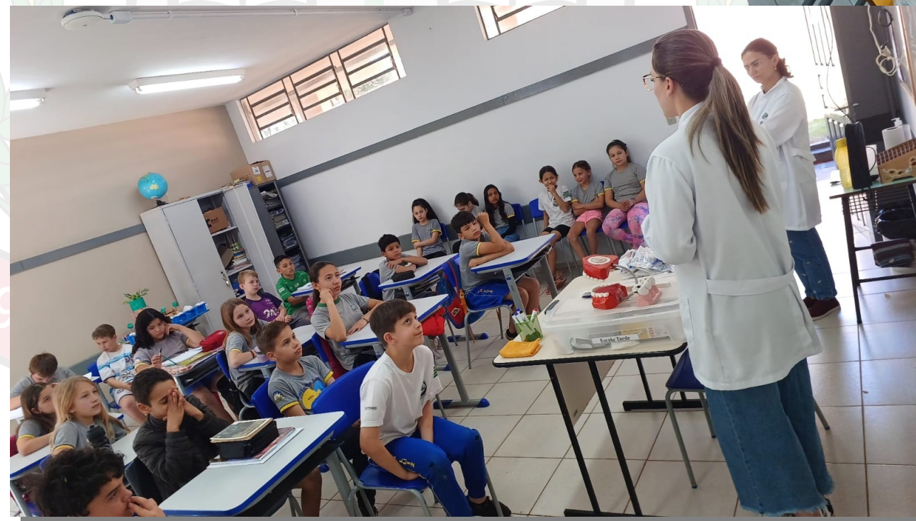
PSE na Escola de São Luiz do Oeste