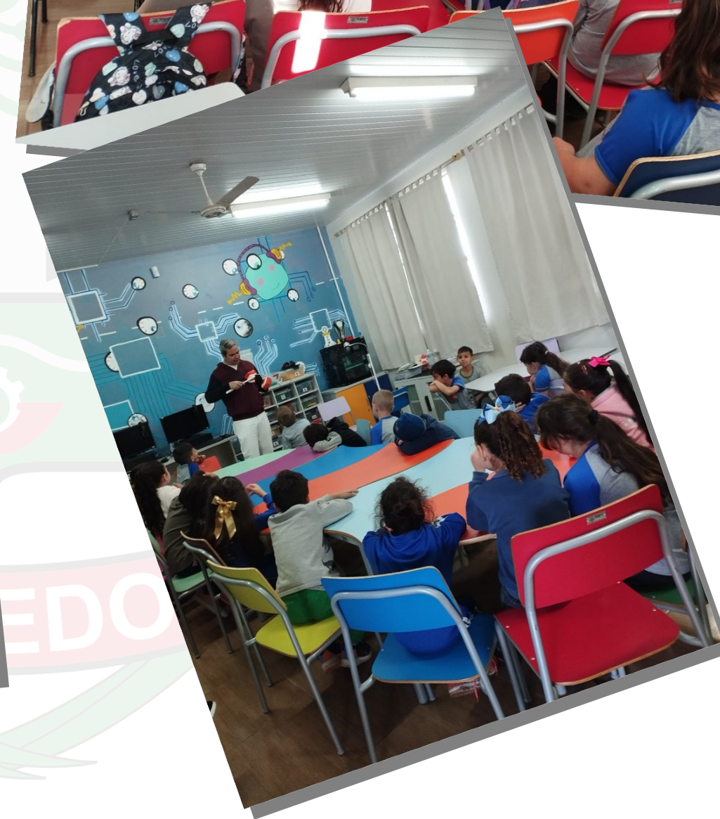
PSE na Escola realizada pela Unidade de Saúde de Dois Irmãos