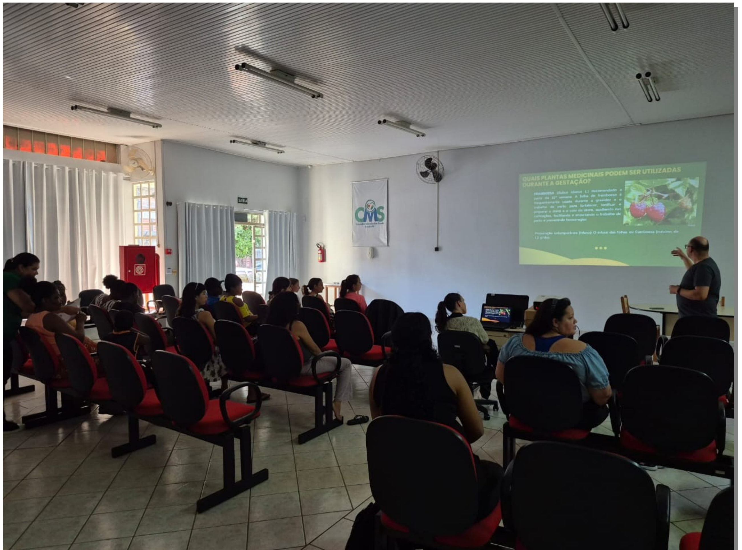
Grupo de Gestantes recebendo informações sobre fitoterapia AMI (Ambulatório Materno Infantil)