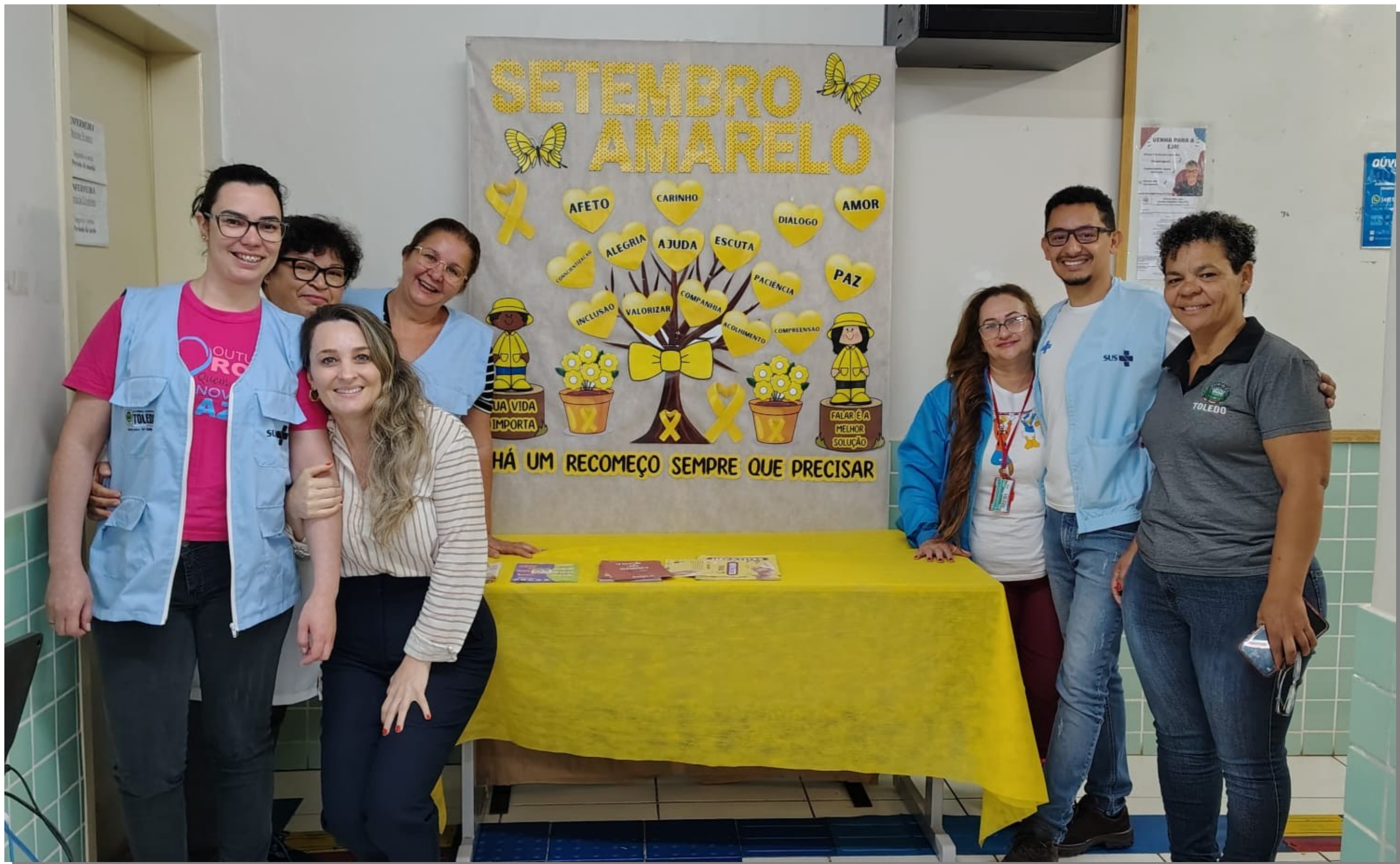
CENTRO DE SAÚDE