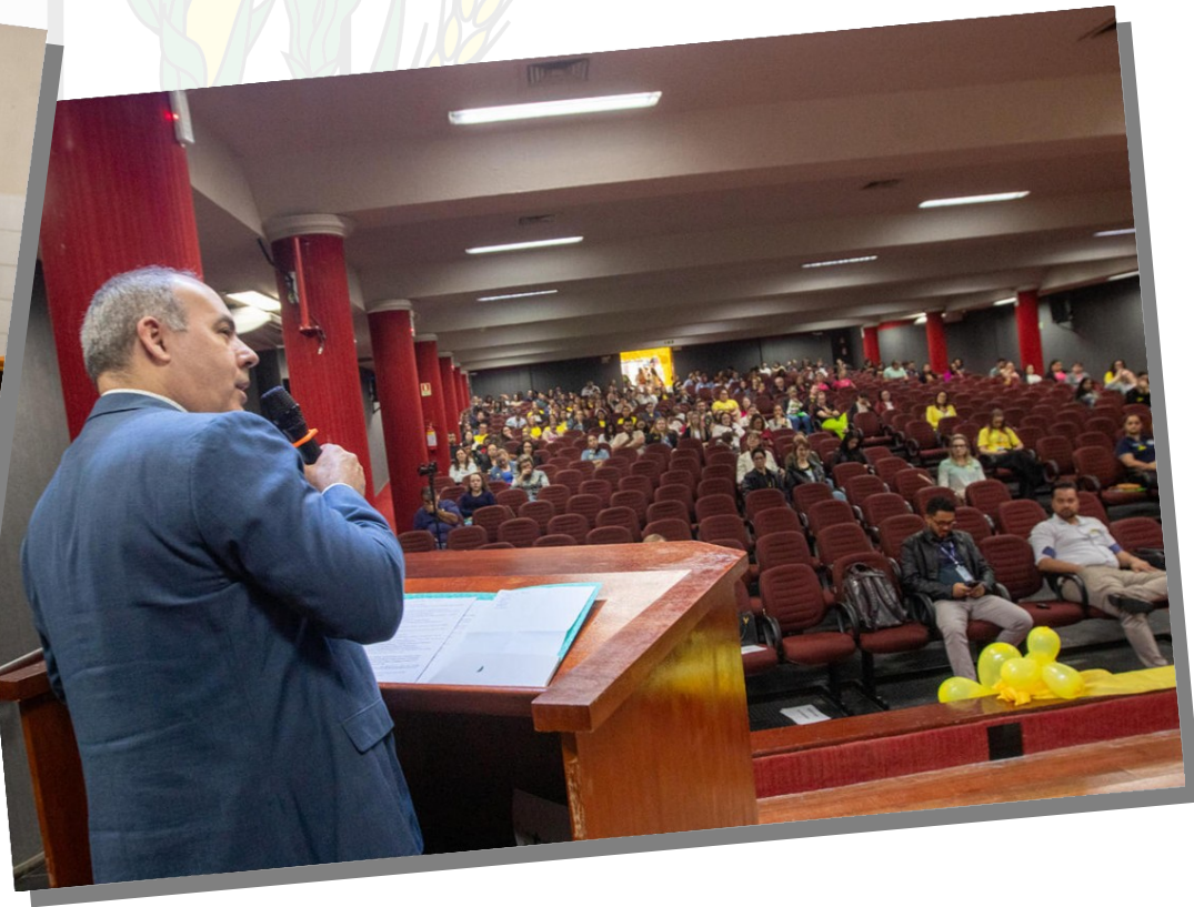
O anfiteatro do câmpus 1 da Universidade Paranaense (Unipar), em Toledo, foi palco dias 25 e 26, do evento "Setembro Amarelo 2025 – Movimento pela Vida", organizado pelo Departamento de Saúde Mental (DSM), vinculado à Secretaria Municipal de Saúde (SMS). A iniciativa é o ponto central da programação, em nível local, alusiva à campanha mundial de conscientização, prevenção e enfrentamento ao suicídio.