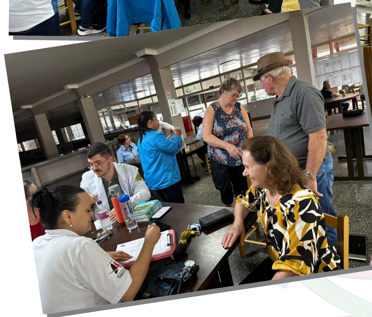
Realização de Estratificação de Risco do Idoso realizado pela equipe da Unidade de Saúde de Dez de Maio