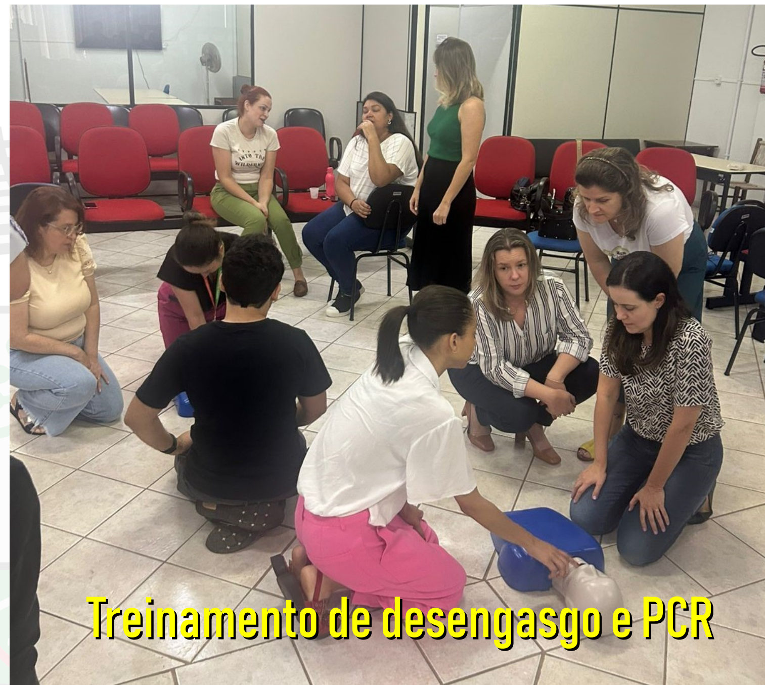
Treinamento de desengasgo e PCR