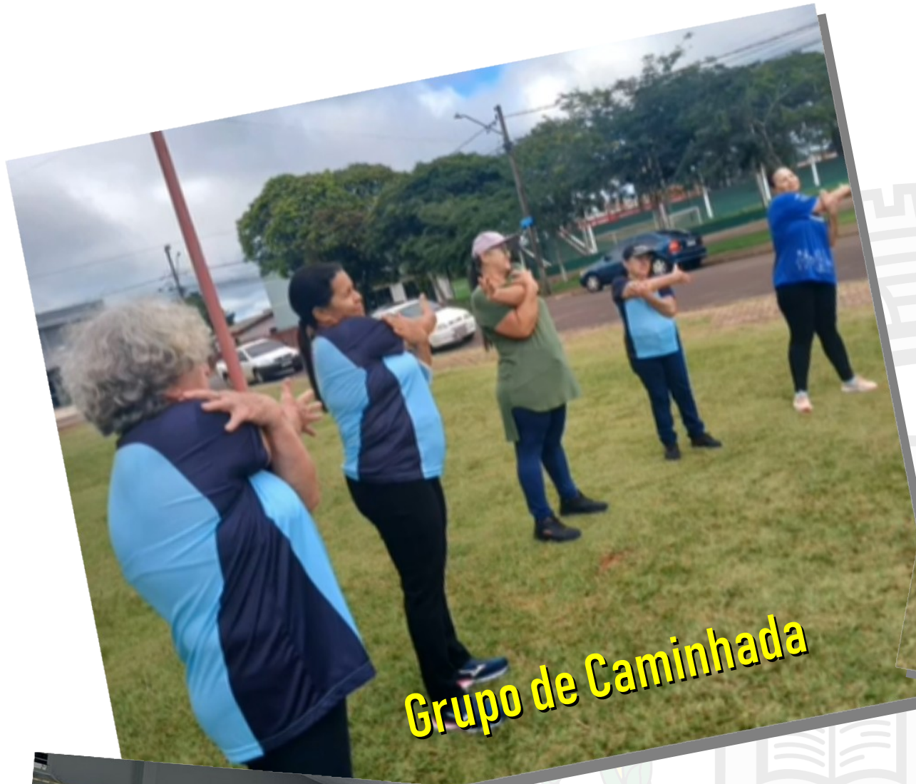
Grupo de Caminhada