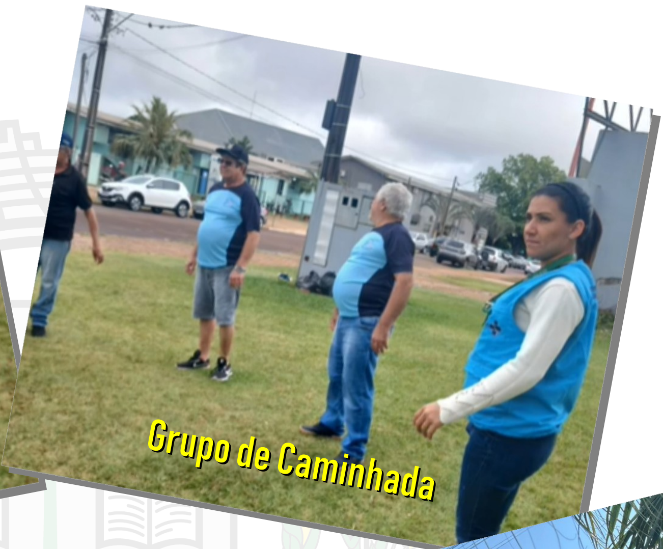
Grupo de Caminhada