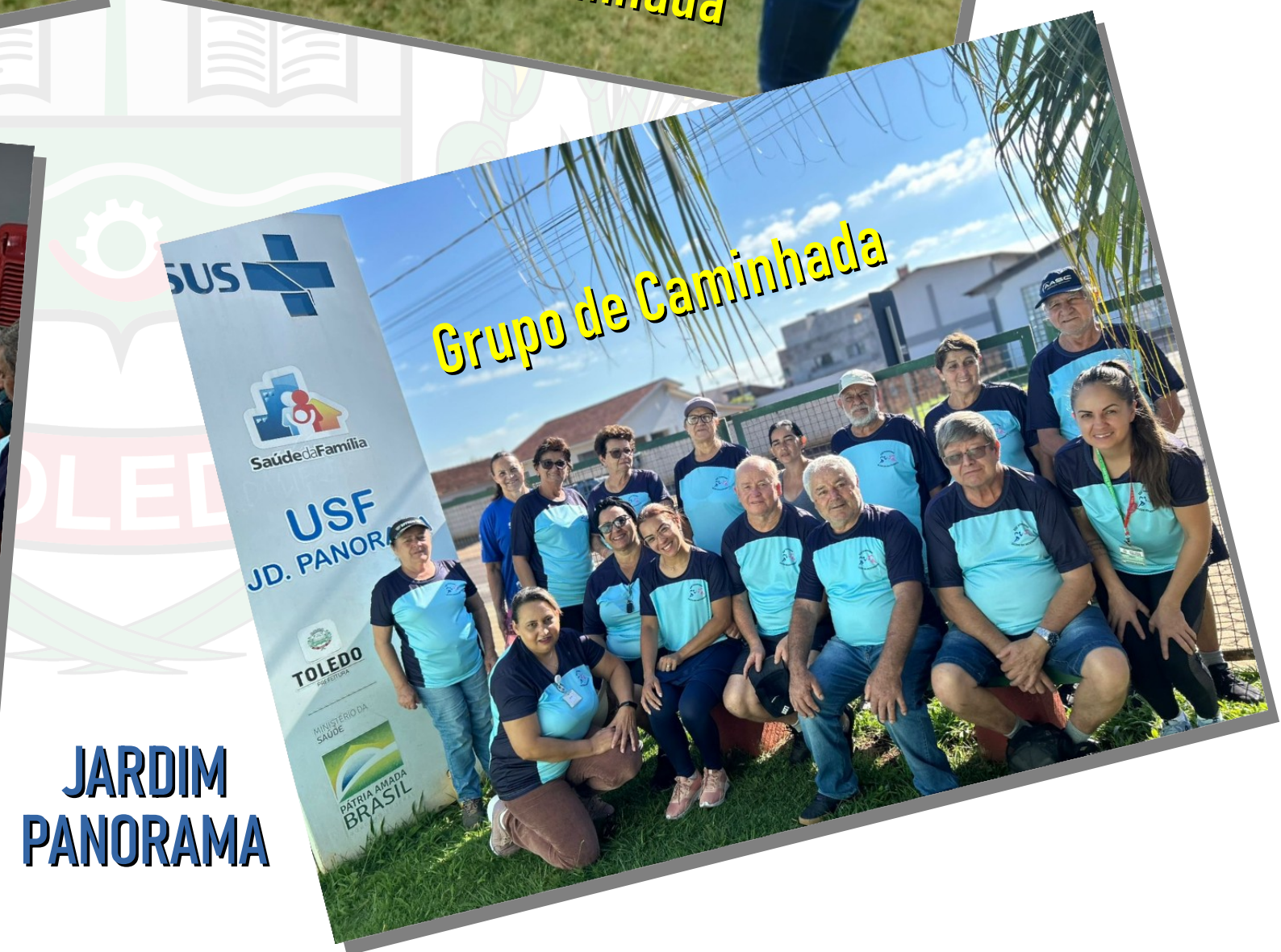
Grupo de Caminhada