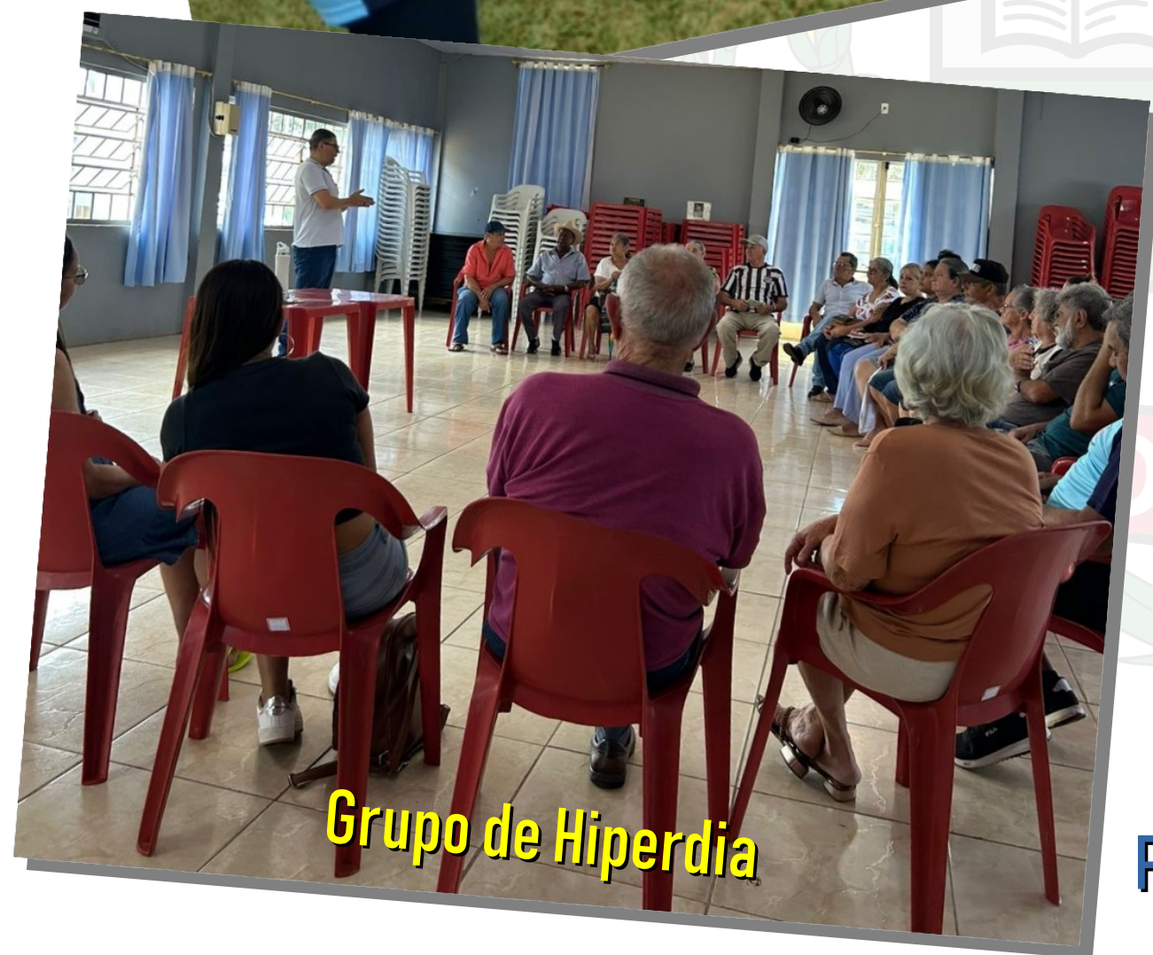
Grupo de Hiperdia