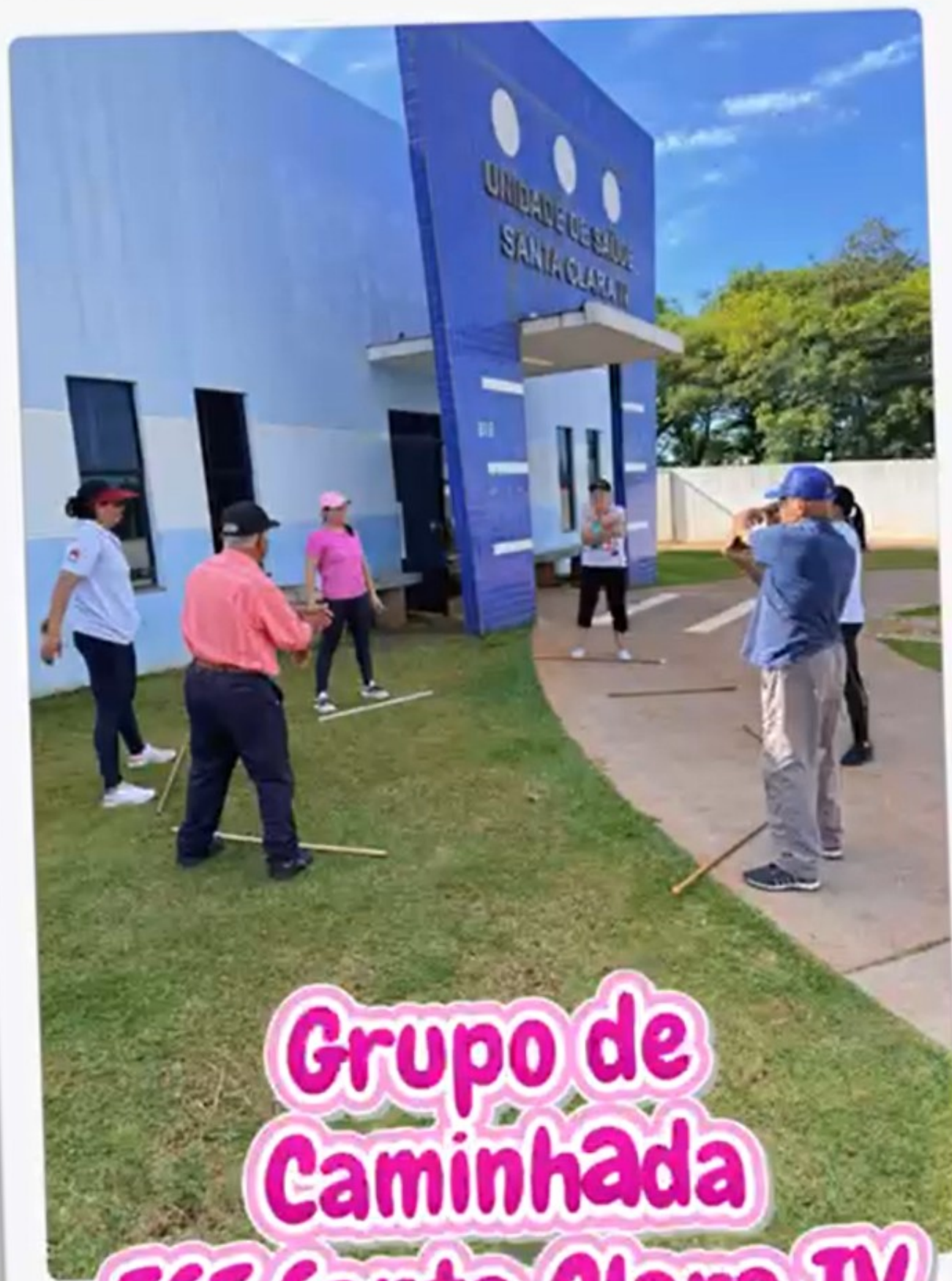
Grupo de Caminhada ESF Santa Clara IV