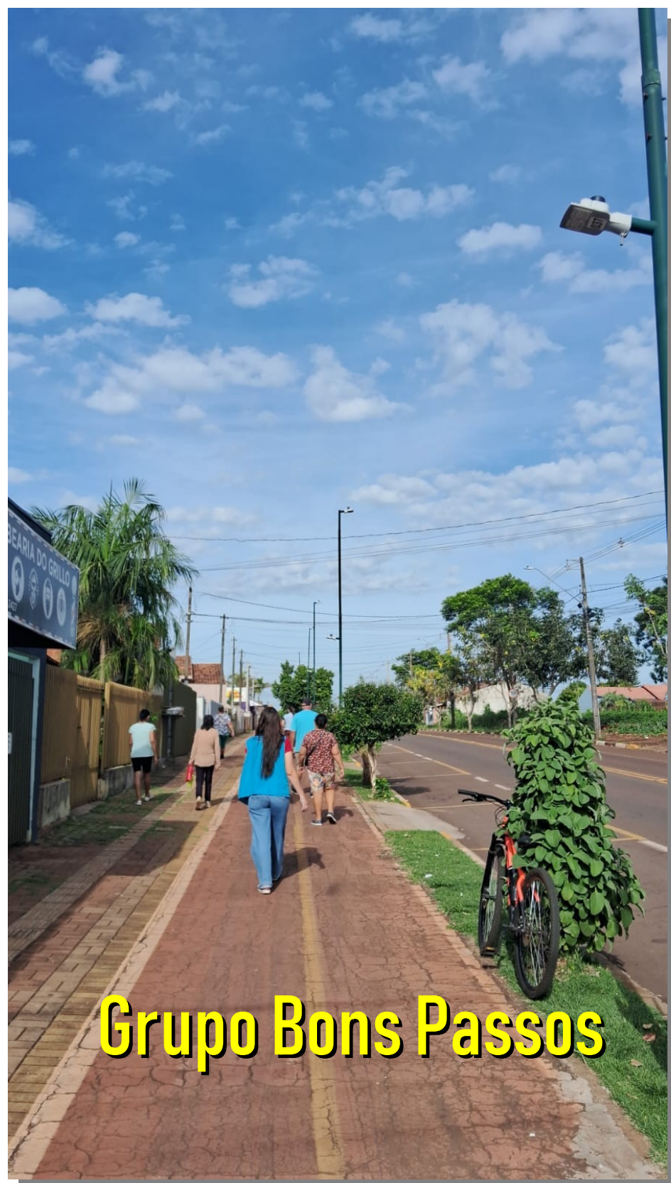
Grupo Bons Passos