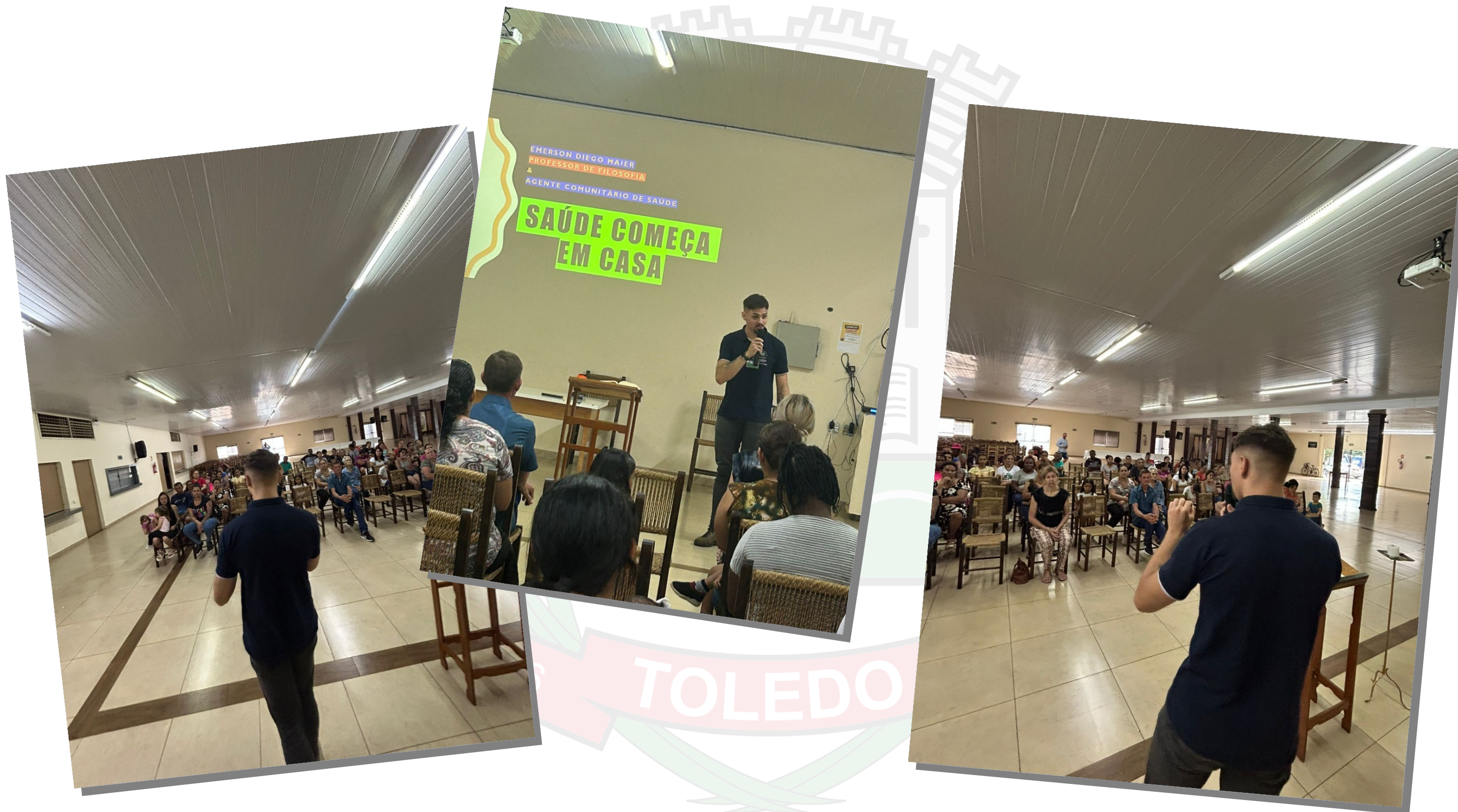
Jd. Panorama Palestra Saúde Começa em Casa. Auxílio Fraternal Igreja Sagrada Família