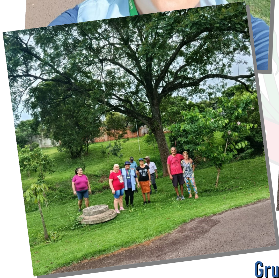
Jd. Paulista Grupo de caminhada Passos que Curam