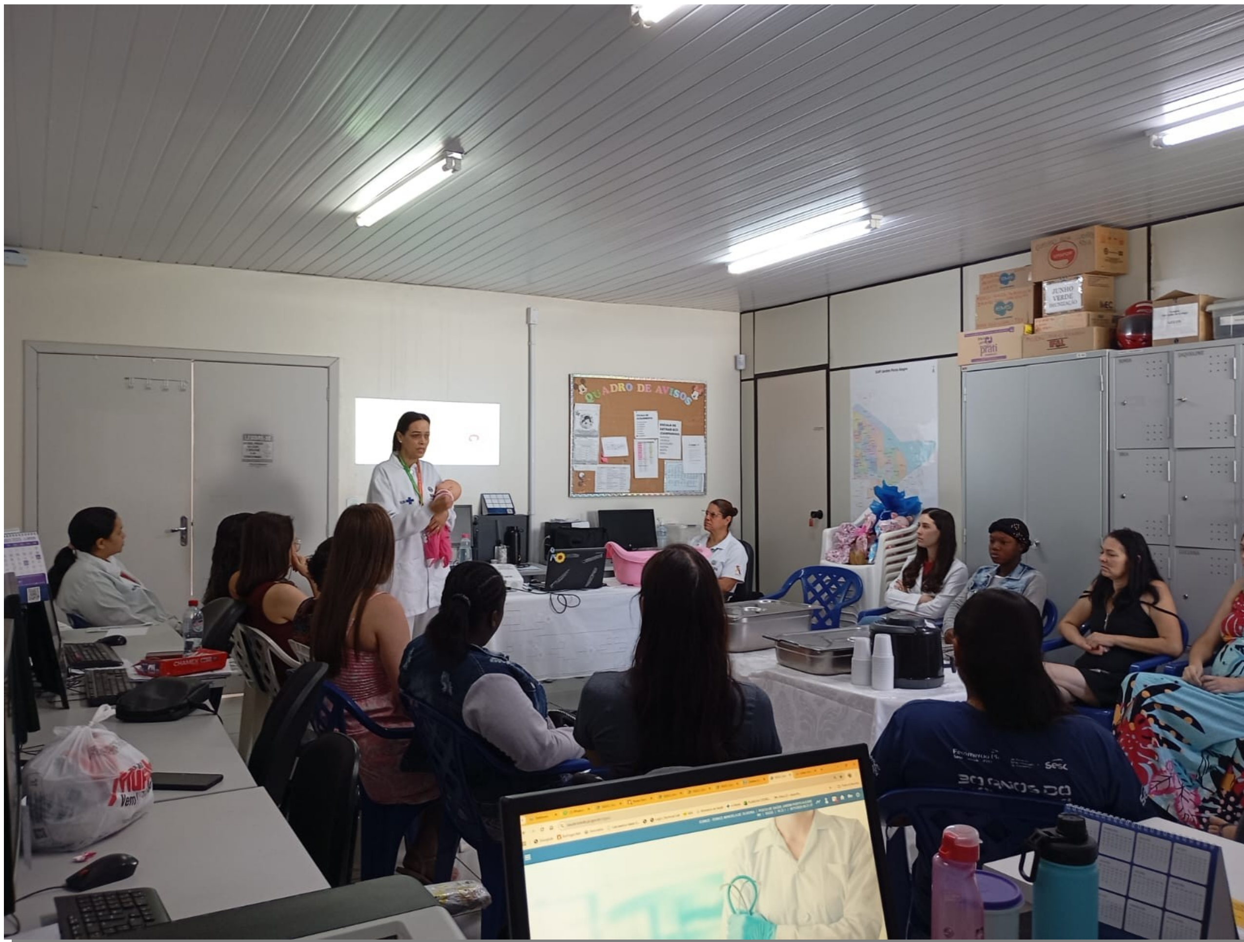
Reunião com o Grupo de Gestantes atendidas na Unidade de Saúde do Jd. Porto Alegre