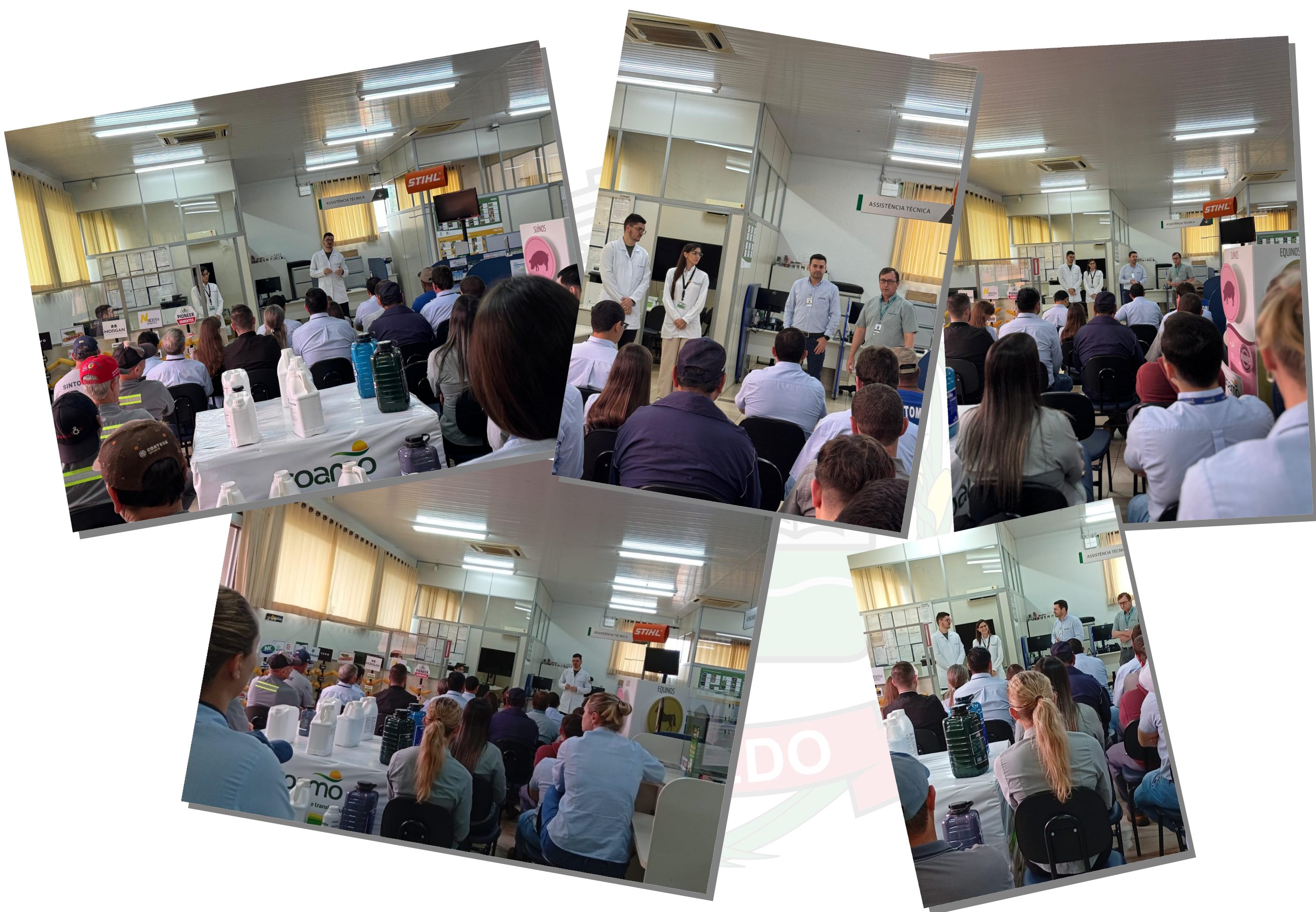
Campanha de conscientização novembro azul na empresa Coamo em Dez de Maio e realização de teste rápidos de ISTs