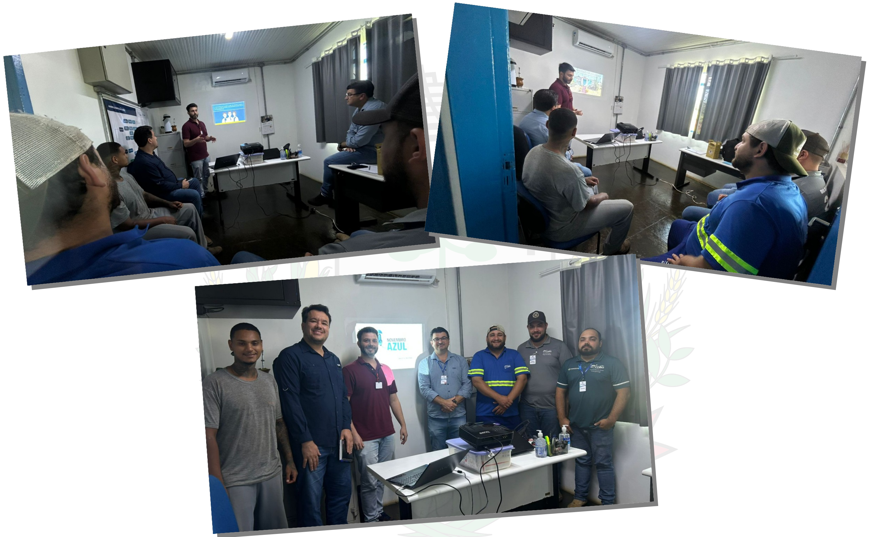
Conscientização sobre o Novembro Azul realizado pela equipe de Saúde de Concórdia do Oeste na empresa Coamo.